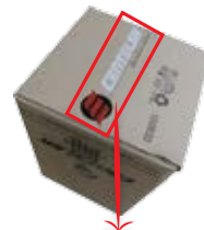
Cinta marca CENTELSA logo blanco, usada en Distribución.