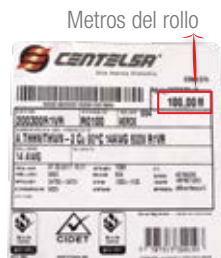
Adhesivo identificación rollo

Aparte de la cinta, todas las cajas y carretes llevan adheridos sticker de identificación (etiquetas), los cuales contienen información detallada del material que lleva cada unidad en su interior: