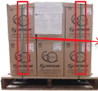
Zuncho de seguridad

Los materiales tipo esmaltado, además de salir palletizados de CENTELSA , salen con zuncho de seguridad.