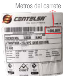
Adhesivo identificación carrete, lote genérico.

Esta etiqueta determina el tramo o cantidad en metros del rollo y demás información del material que va al interior de cada caja