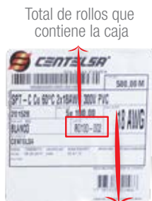
Etiqueta de caja.

Relaciona el peso aproximado del contenido de la caja