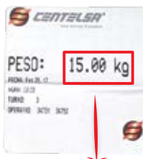
Etiqueta de peso.

Esta etiqueta determina el tramo o cantidad en metros de material que contiene cada carrete.