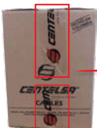
Cinta marca CENTELSA , parte superior e inferior de la caja.

Todos los materiales que despacha CENTELSA y que van empacados en cajas, tienen información importante al momento de realizar el reporte de una novedad, dicha información hace referencia a la cinta con la que van selladas las cajas