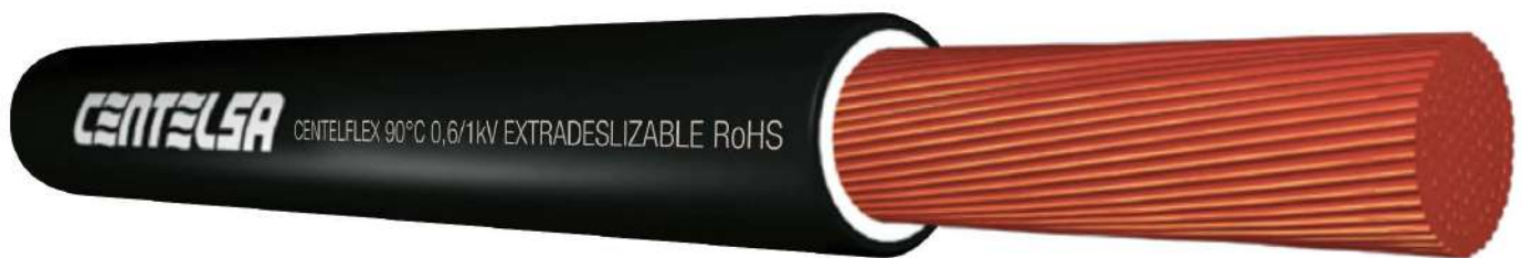
Figura 1. Cable CENTELFLEX 90°C 0,6/1kV EXTRADESLIZABLE RoHS en configuración Monopolar

Cubierta Externa (Chaqueta): Policloruro de Vinilo (PVC) retardante a la llama, resistente a los rayos ultra violeta (SR – Sunlight – Resistant), a los aceites, a la abrasión y sitios con saturación de agua. Cubierta Extradeslizable y certificada RoHS.